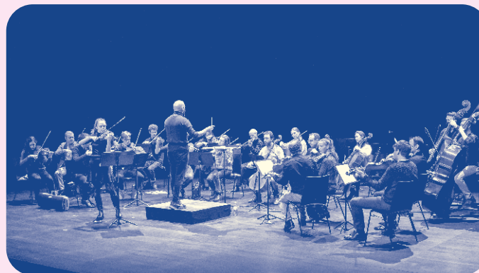
Orchestre International de Genève

Orchestre International de Genève