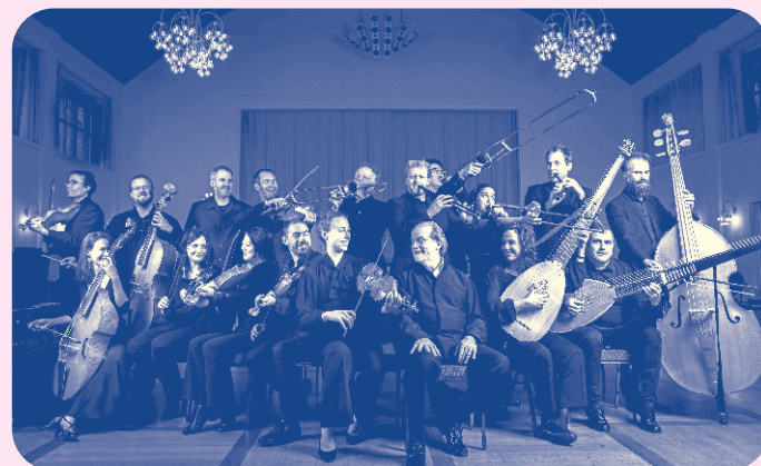
La Cetra, Barockorchester Basel