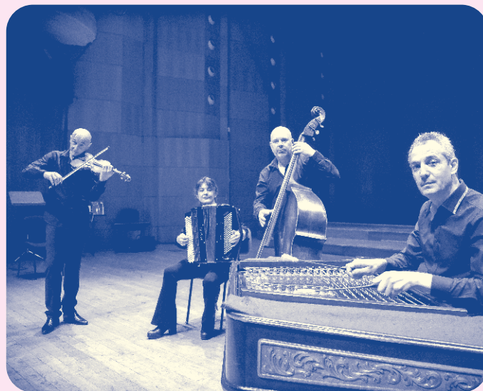
The Colors of Invention ©Francesco Mammarella